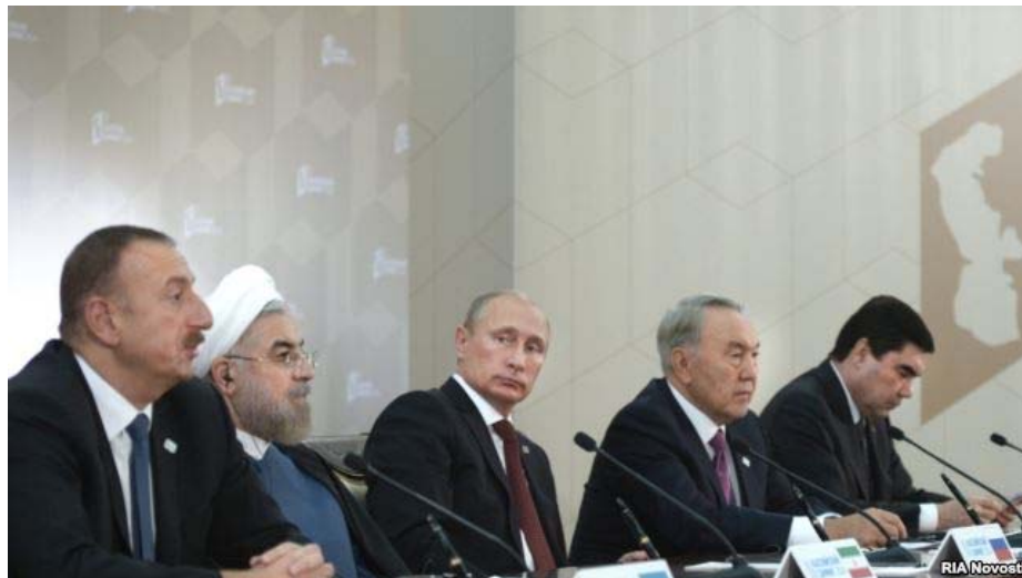
اجلاس سران کشورهای ساحلی دریای خزر