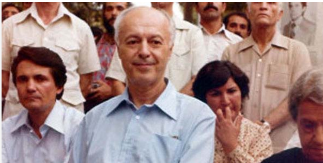
احسان طبری، تهران ۱۳۵۸

در صدمین سالگرد تولد احسان طبری و با کمک اسناد و مدارک نویافته قصد دارم روند شکسته شدن احسان طبری و تغییر ناگهانی او را نشان دهم. در نوشتار بعدی که امیدوارم به زودی چاپ شود به چرایی این اعترافات و مسئله سندرم استکهلم خواهم پرداخت. در اینجا باید از پروفیسور تورج اتابکی و پژوهشکده بین المللی تاریخ اجتماعی نهایت امتنان را داشته باشم که اسناد و مدارک مورد نیازم را سخاوتمندانه در اختیارم گذاشت. بدیهی است که مسئولیت اشتباهات موجود در این متن همه بر عهده من است.