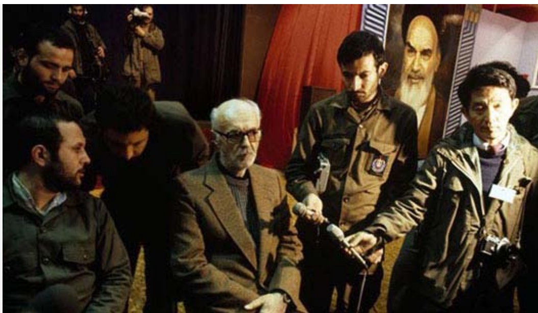
در زندان، در محاصره اعترافگیران