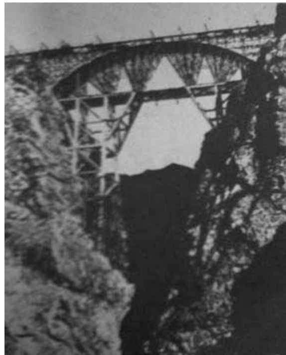
پل در حال احداث ورسک

باید توجه داشت که این بنا برخلاف ادعای برخی افراد مبنی بر ساخته شدن آن بدست مهندس آلمانی بنام ورسک، ساخت یک معمار اتریشی متولد وین به نام ((والتر اینگر)) در سال 1310 هجری شمسی است و نام این پل بر گرفته از نام قریه ورسک واقع در قسمت شمالی این پل می باشد. قریه ورسک در زمان احداث پل دارای حدود 20 خانوار جمعیت بوده است.