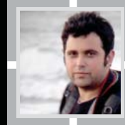
مصطفی کاظمی شهلاهی عکاس مازندنومه

گزارش تصویری از همایش شیر خوارگان حسینی، مصلاهی امام خمینی ساری