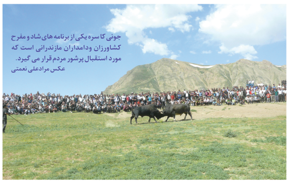
جونی کاسره یکی از برنامه های شاد و مفرح کشاورزان و دامداران مازندرانی است که مورد استقبال پرشور مردم قرار می گیرد.

نتیجه ۲- تصور نمی کنید بین این دو عکس شباهت زیادی وجود دارد؟!