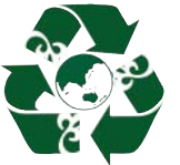
مدیریت سازمان پسماند شهرداری ساری

در سومین نمایشگاه جامع مدیریت شهری و دستاوردهای شهرداری های سراسر کشور که در مصلائی تهران برگزار شد،