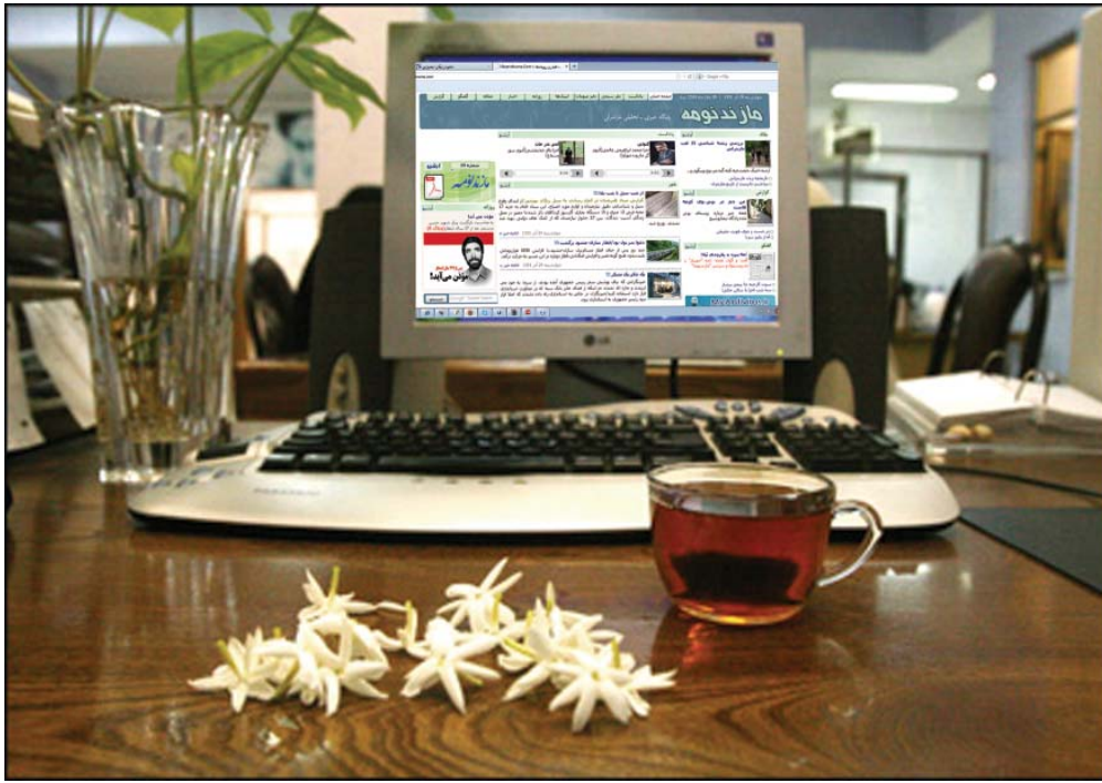
مازندنومه به عنوان نخستین پایگاه خبری تحلیلی استان مازندران کارش را در پاییز ۱۳۸۰ آغاز کرد

آید. بگذریم... مازندنومه پاییز امسال یازده ساله شد. این کار چه جذایبیتی دارد که شما بیش از یک دهه به آن مشغولید؟ واقعا برای تان منفعت مالی دارد یا به لحاظ جایگاه اجتماعی که از این پایگاه اطلاع رسانی کسب کرده اید، نمی توانید از آن دست بردارید؟