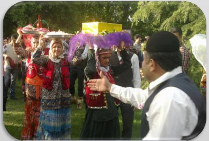
مراسم "سرتاشی مجیمه" یا "مجمه سری"