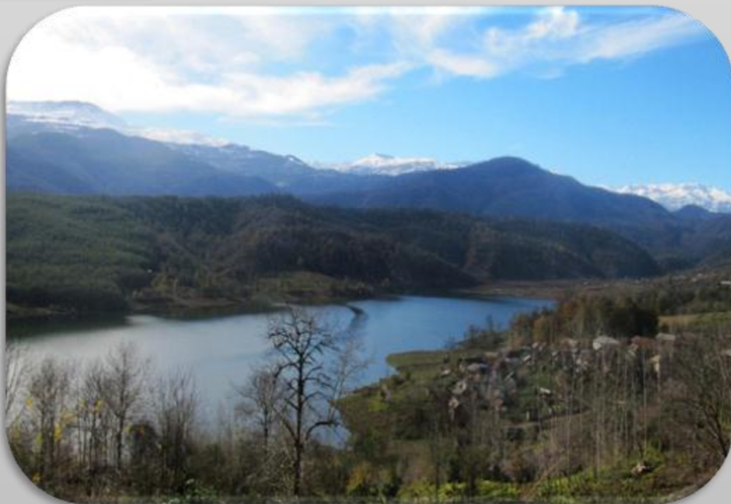
سد البرز - نمای جنوبی

در طول مسیر خله جاها روهار {رود خینه} و جاده با هم هم مسیر بونه که تماشای و خالی از لطف نیه! فقط اتا نکته، مایحتاج قبل از برسین به لغور تهیه هاکنین، چون سد پلی هنوز امکانات آنچنانی وجود ناینه! این سد دله تلاجی، کپور و اورنج بعنوان ماهی بومی دره، که علاقمندان توننه ماهی گیری هم هاکنن!!! از نظر من اشکال ناینه! دی