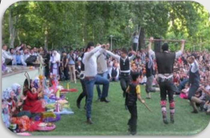
چکه سیمای دی