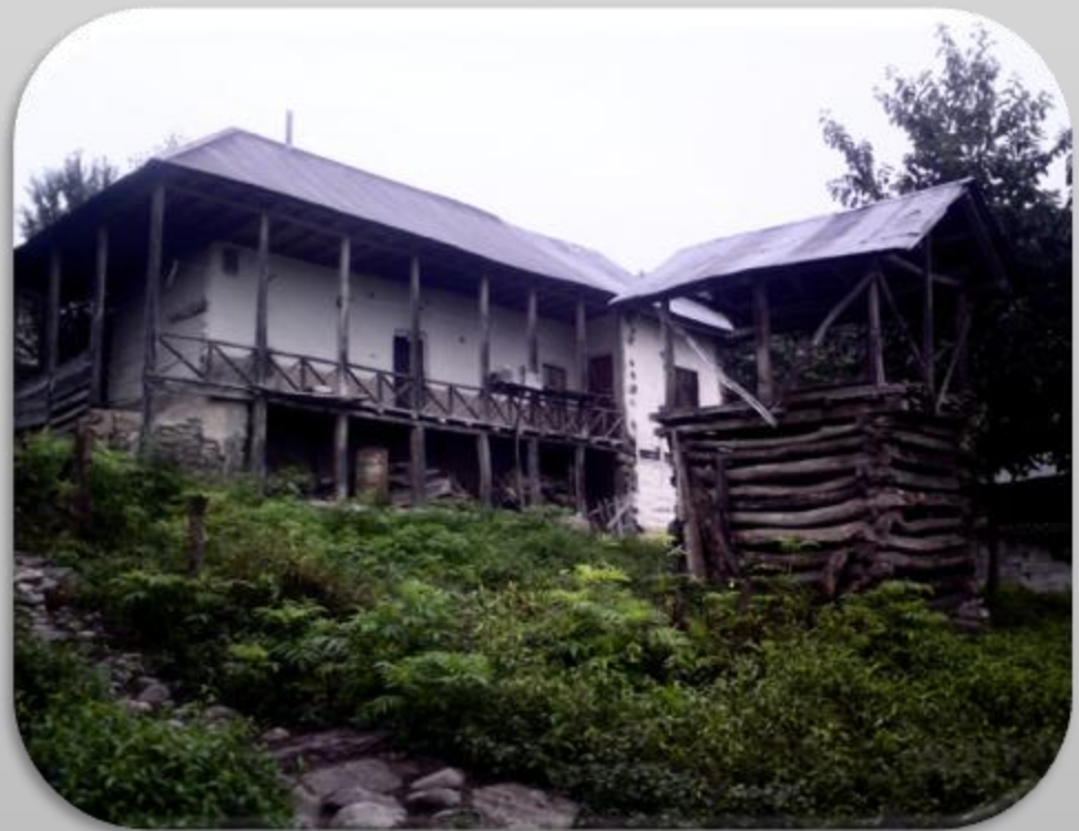
روستای میراکلا